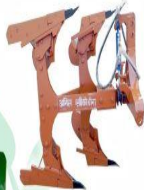
अनिल पल्टी प्लाऊ