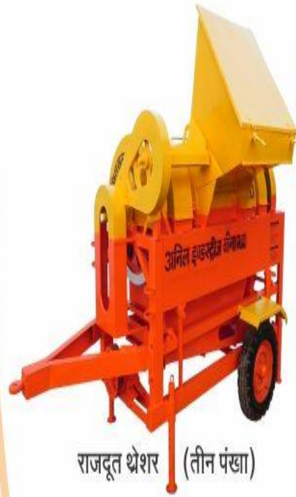
राजदूत थ्रेशर (तीन पंखा)